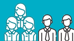
Comité de direction